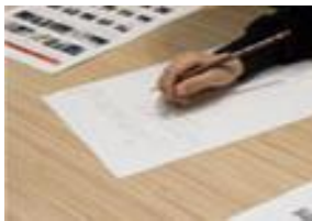
CMづくりのプランニング